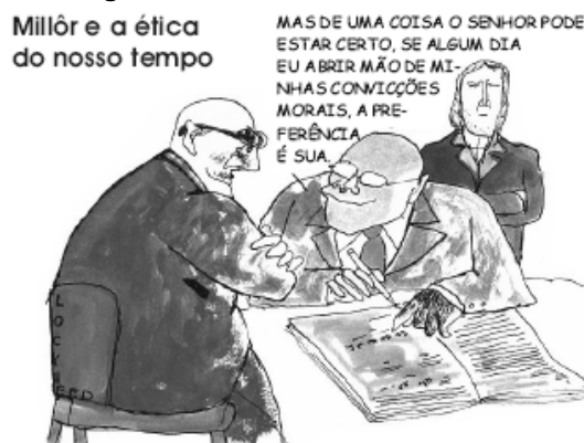
Millôr Fernandes. Veja, São Paulo.

A charge de Millôr apresentada aponta para