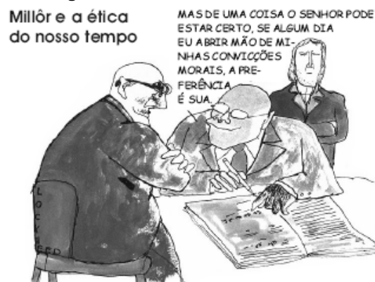
Millôr Fernandes. Veja, São Paulo.

A charge de Millôr apresentada aponta para